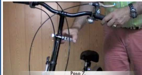
Paso 7. 7. Cerrar el cierre rápido que mantiene la altura del manillar deseada.