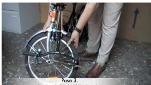
Paso 3. Gire la rueda del frente 180° (media vuelta). 3. Girar la rueda delantera 180° (media vuelta).