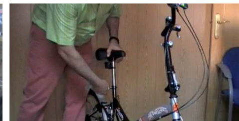
Paso 10. Colocar el sillín a la altura deseada. Utilizar el cierre rápido del sillín.