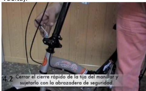
4.2 Cerrar el cierre rápido de la tija del manillar y sujetarlo con la abrazadera de seguridad.