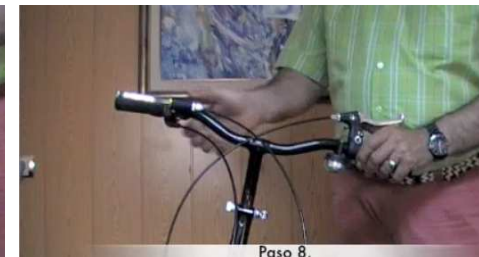
Paso 8. 8. Colocar las manetas horizontalmente y el timbre en la parte superior del manillar.