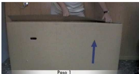
Paso 1 1. Apertura de la caja