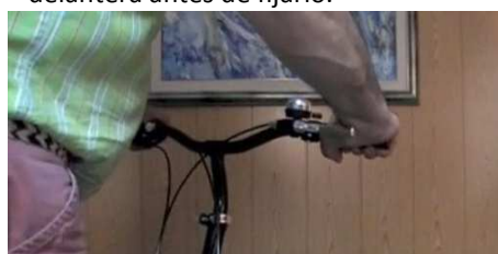
4.3. Alinear el manillar con la rueda delantera. (Buscar la disposición final del manillar para posteriormente fijarlo).