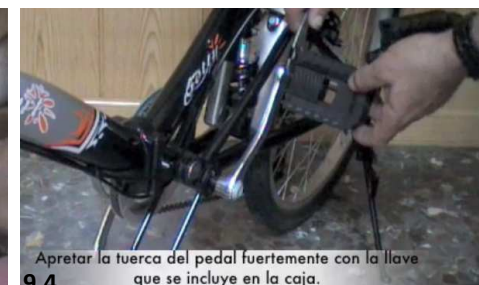
9.4 Apretar la tuerca del pedal fuertemente con la llave que se incluye en la caja.