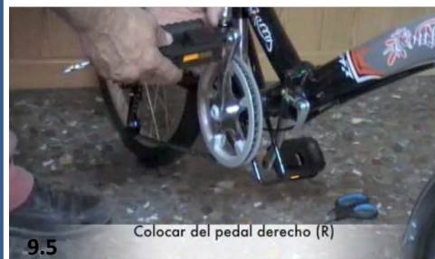
9.5 Colocar del pedal derecho (R)