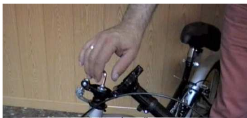
5. Fijar el manillar. Volver a abrir la tija del manillar desde su posición de alineación y fijarlo apretando el tornillo de la tija.