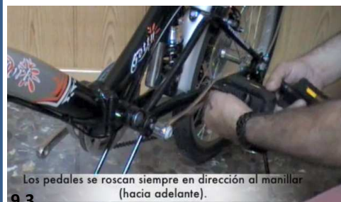
9.3 Los pedales se rosca siempre en dirección al manillar (hacia adelante).