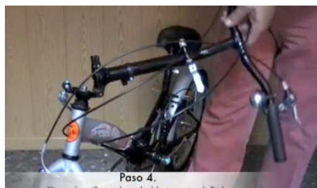
Paso 4. Alinear el manillar con la rueda del frente antes de fijarlo. 4.1. Alinear el manillar con la rueda delantera antes de fijarlo.