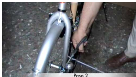
Paso 2 2. Cortar las bridas.